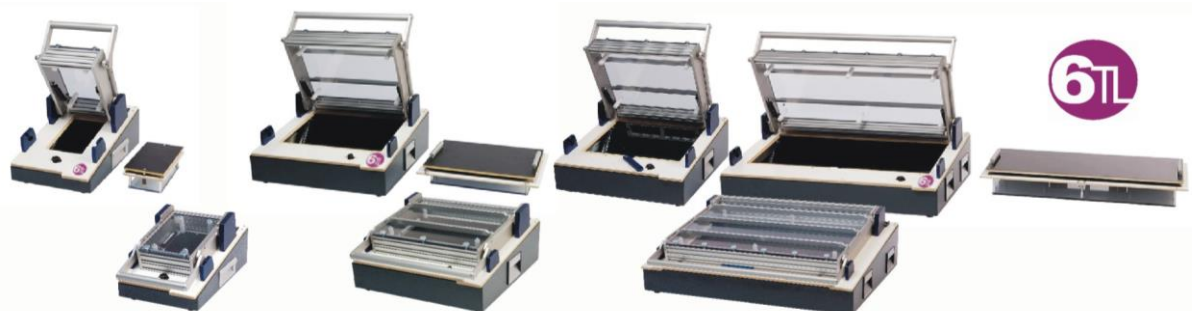
6TL01 UUT 197mm x 114mm (bxh)

Een fixture systeem met interne Mass Interconnect interface tussen basis unit en wisselcassette.